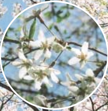
「小山田彼岸桜樹林」 天然記念物（昭和3年国指定）

五泉市小山田地域の山ろくに繁茂しており、植樹当時（1850年ころ）は、1000本を数え、開花時は、万山これ桜の花に埋まったといわれています。