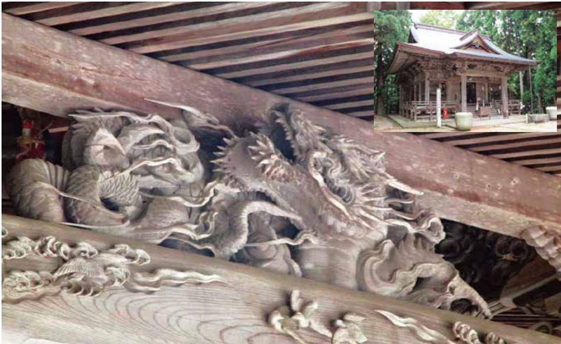
■ 石動神社拝殿欄間彫刻 三条市指定有形文化財