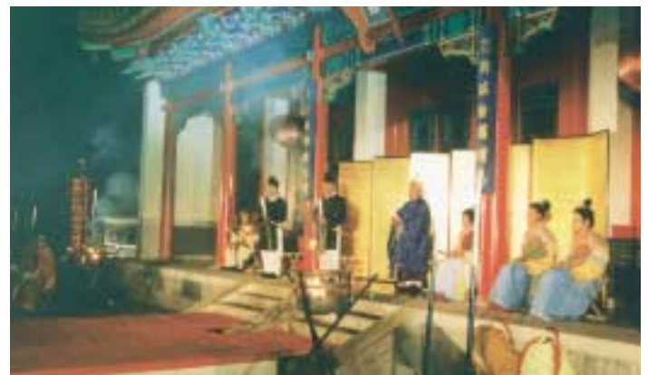
西遊館での献上式