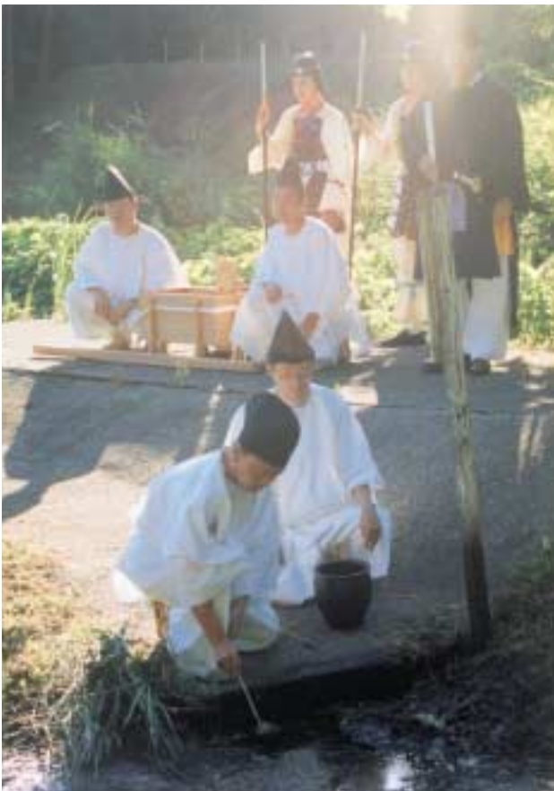
草生水献上場での採油式

役職員一同、今後ともより安全で確実な資産運用を心がけ、福利厚生事業の充実に努めますので、よろしくお願いたします。