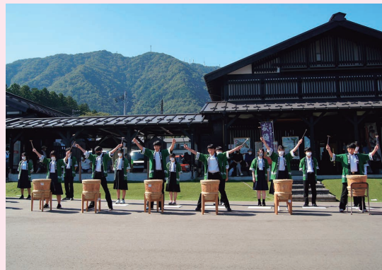
弥彦村立弥彦中学校 ふるさとキャラバン (弥彦おもてなし広場)

当校3年生は、「弥彦燈籠まつり」と「ふるさとキャラバン」で、弥彦村に伝わる「木遣り、樽太鼓、横笛」を披露します。氏子青年会の指導を受けながら練習を重ね、心のこもった見事なパフォーマンスで弥彦村をPRします。弥彦中学校の伝統として、先輩から後輩へ、活動を大切に受け継いでいきます。