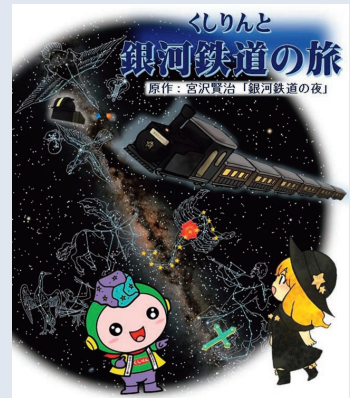
星座を紹介する自作番組

昨年の春、「上越天文教育研究会」と連携しながら取り組んできた地道な活動が評価され、日本天文学会の「天文教育普及賞」を受賞した(130号で紹介)。身が引き締まる思いで授賞式に参加した。これを励みに、今後も工夫しながら、星空の魅力を多くの人に伝え、天文教育の普及に努めていきたい。