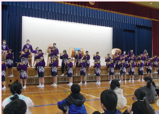
新発田市立紫雲寺小学校「干拓太鼓」

平成3年度の創立百周年記念式典で初めて披露されて以来、毎年、6年生が師匠、4、5年生が弟子となって演奏が引き継がれてきました。今年で32代目。練習・発表とも、制限のある中ですが、豊かな土地を求めた先人の「干拓魂」は、演奏を通して子どもたちにしっかりと受け継がれています。