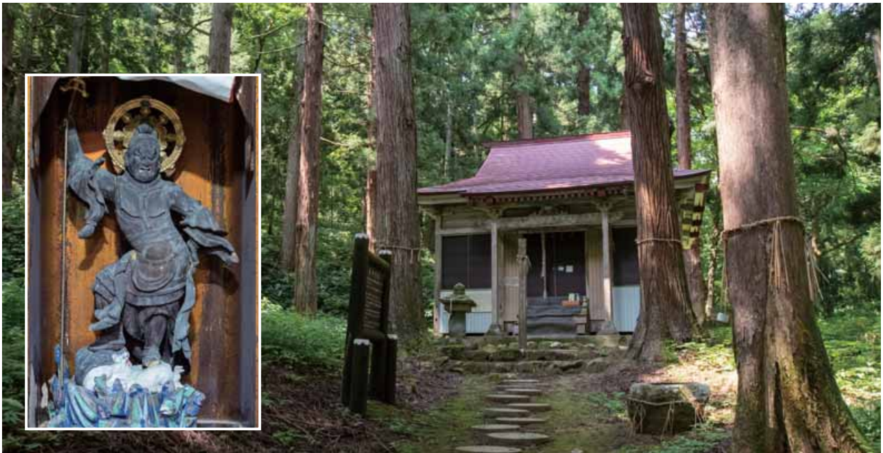
■ 謙信公の祈願所 滝寺毘沙門堂

泰澄大師が和銅5年(712)に堂(吉祥寺)を建立したことが始まりと伝えられています。上杉謙信公が信仰し、出陣の際戦勝祈願をしたとされています。慶長5年(1600)の上杉遺民一揆の際、堂塔伽藍が焼かれ、その後再建されました。基礎には、鎌倉時代のものとみられる五輪塔が転用されています。木造毘沙門天像は堂再建時招来されたものとされ、像高64.5cm、憤怒の表情で、動きのある姿をしています。鎌倉時代後期から南北朝時代の制作と考えられています。