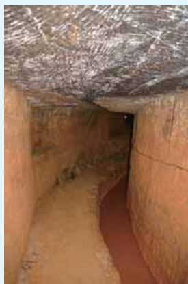
上：水上輪の図 下：天井に化粧彫りがある南沢疎水道

新潟県・佐渡市は以下のように記している。「16 世紀後半から 19 世紀半ばの極東日本の豊かな金銀山の島において、国家の管理・運営の下、海外との技術交流が限られる中、ヨーロッパとは異なるシステムとして発展を遂げ、世界に誇る質・量の金を生産した伝統的手工業による大規模かつ長期に継続した金生産システムを示す稀有な産業遺産である」