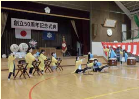
柏崎市立高柳小学校 黒姫山太鼓・四半的弓道

地域の方から教えていただく「四半的弓道」と「黒姫山太鼓」。どちらも子どもたちに人気です。地元信仰の山「黒姫山」の名を冠する勇壮な演奏を、音色の違う3種類の太鼓で奏でます。また、秋から冬にかけて行う四半的弓道は、座して心を落ち着けて、小さな的を狙います。地域の心が受け継がれています。