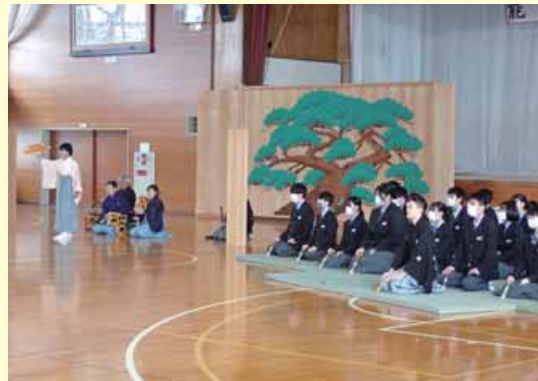
新潟県立佐渡中等教育学校 能楽教室

開校当初より3年間を通して、前期生全員が佐渡の伝統芸能である「能」を学習しています。平成27年度にはユネスコスクールにも承認されました。専門家から指導を受け、学習の成果を体育館で保護者や地域の方に披露し、能の継承に努めています。昨年度は「羽衣」と「胡蝶」を発表しました。