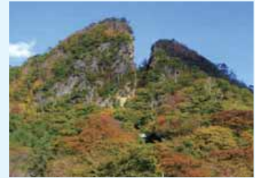
露頭掘り跡の「道遊の割戸」

金鉱石を掘り出し小判にするまで、採掘・選鉱・製錬・小判製造と一連の工程が伝統的手工業により行われた。西三川には、金を含む土石を洗い流した「金山江」という水路跡が遺っている。鶴子では、地表から掘ってすり鉢状になった「露頭掘り」の跡を見ることができる。相川金銀山には、さまざまな掘削法による坑道がアリの巣状に巡らされており、その総延長は 400km に及ぶ。