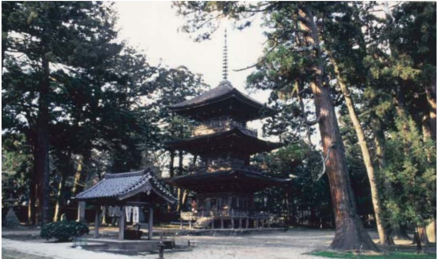
国の重要文化財 乙宝寺の三重塔 (大正12年指定)

役職員一同、福利厚生事業の充実と教育文化の振興に一層努力いたしますので、今後ともご支援をお願いいたします。